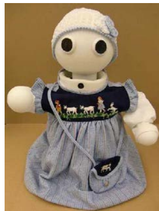
図 3 会話支援ロボット