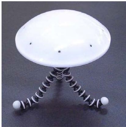
図 2 無線型音源定位装置

認知活動介入支援システムとして、発話量と笑顔度に基づいて、話者交代を支援するシステムを開発した(論文 3)。発話量のばらつきをモニタリングしながら、参加者全体の笑顔度が下がったタイミングで、発話量が多い参加者の発話を抑制し、発話量が少ない参加者に発話を促すことで、会話の盛り上がりを損なわずに、発話量のバランスを取ることに成功した。この他、企業と共同で、発話量計測を非接触で行うことができる無線型音源定位装置(図 2、プレスリリース 2)や、会話支援ロボット(図 3)を開発することに成功した。