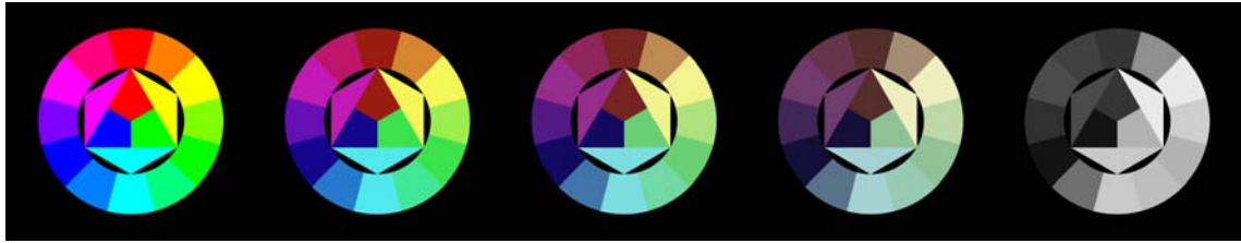
図 2(HSB 色相環)