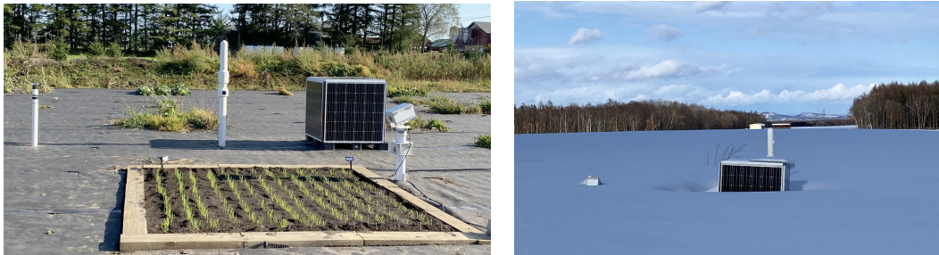
(2) 秋播き小麦の時系列データの収集例（秋の播種期から翌年初夏の収穫期まで）