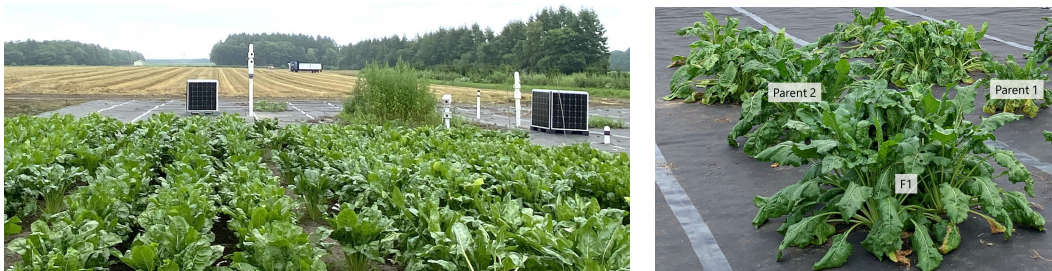
(1) テンサイ（親と F1 の組み合わせ）の形質と植物共生微生物相データを時系列的に収集

農研機構・東大グループは、上記の手法で得られた時系列データから、収量に関わる新指標や微生物の動態と環境変化の関係等、多数の新知見を発見した。また、新型コロナウイルス対応研究として、IoT 機器吸気部の HEPA フィルタで捕捉された埃から、エアロゾル中のウイルス等の情報が得られることを明らかにした。