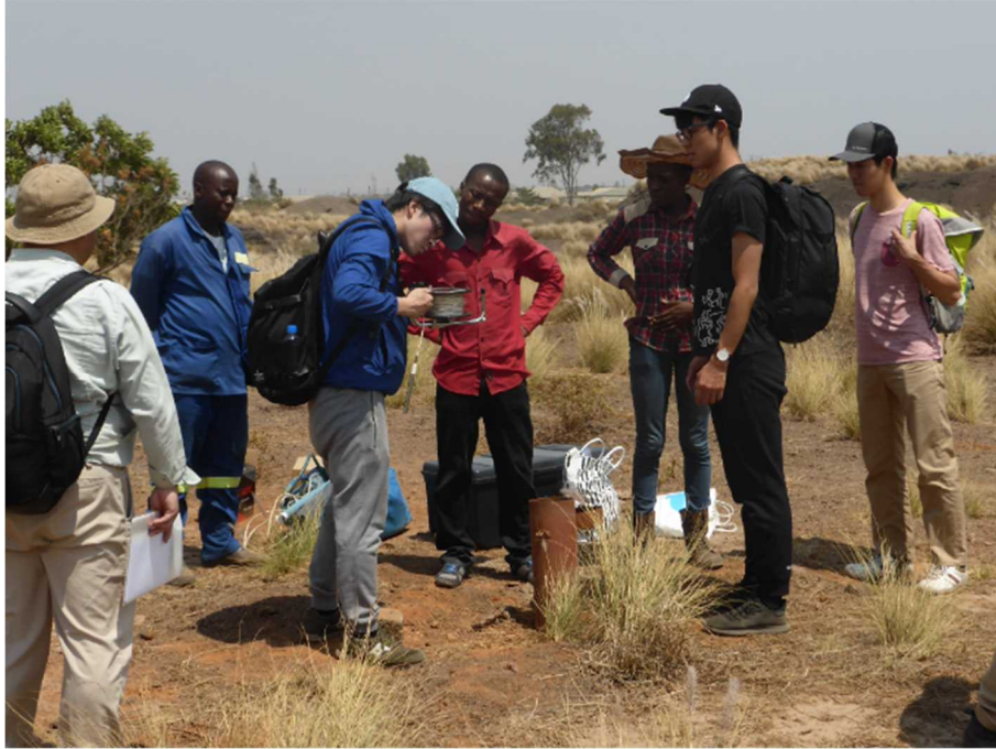
鉱山廃棄物ダンプエリアのモニタリング井戸