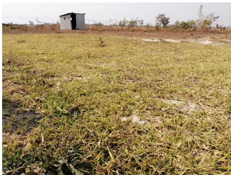
研究対象地で生育調査を行ったイネ科植物が繁茂する様子