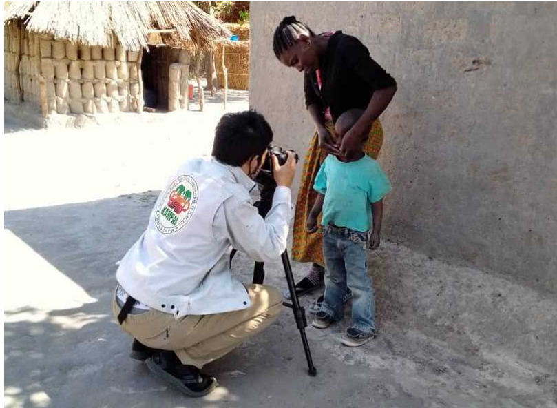
Kabwe 住民の口腔内撮影（予備調査）